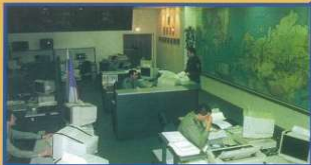
Сбор, обработка данных и информации о радиационной и химической обстановке в зонах заражения (загрязнения)