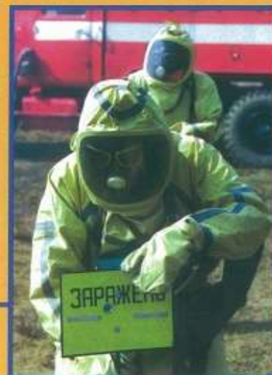
Выбор и соблюдение режимов защиты людей в условиях радиоактивного и химического заражения