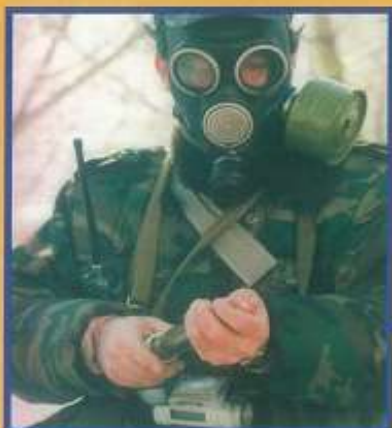
Радиационная и химическая разведка и контроль

Радиационная и химическая защита – это комплекс мероприятий по предупреждению и ослаблению воздействия на людей ионизирующих излучений радиоактивных веществ и опасных химических веществ