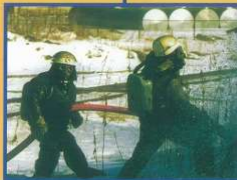
Применение средств радиационной и химической защиты