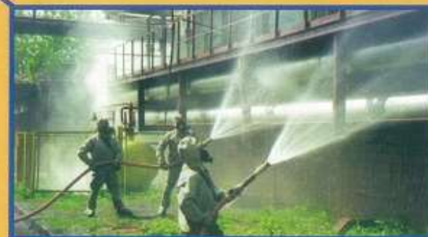
Специальная обработка и обеззараживание участков местности, дорог, объектов, зданий и сооружений