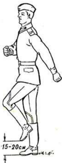
Рис. 4. Шаг на месте

Походный шаг применяется во всех остальных случаях (при совершении марша, передвижении на занятиях и др.).