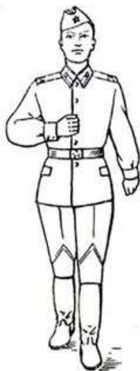
Рис. 4. Действия рук при движении

от тела; назад - до отказа в плечевом суставе (пальцы рук полусогнуты). В движении голову и корпус держать прямо, смотреть перед собой (рис. 4).