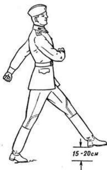
Рис 3. Движение строевым шагом

Движение строевым шагом начинается по команде "Строевым шагом - МАРШ". По предварительной команде подать корпус несколько вперед, перенести тяжесть его больше на правую ногу, сохраняя устойчивость; по исполнительной команде начать движение с левой ноги полным шагом.